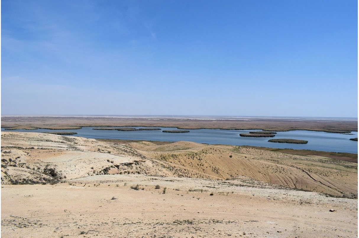
Аральське море сьогодні.