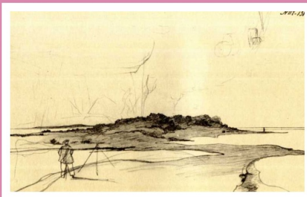
Топограф на березі Аральського моря. Начерк. Папір, олівець. 1848-1849 рр.