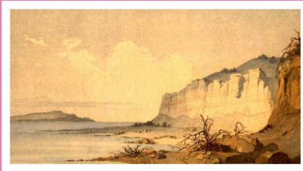
Крутий берег Аральського моря. Папір, акварель. 1848-1849 рр.