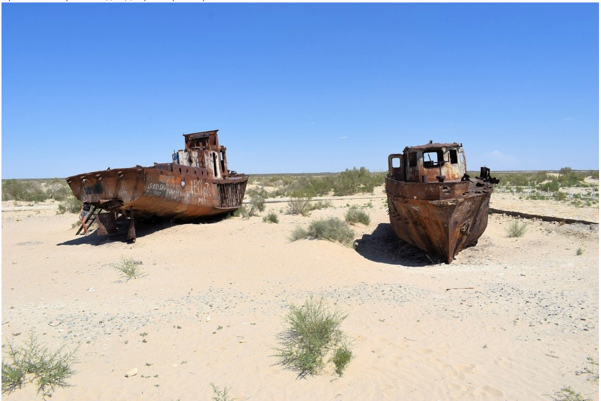
Аральське море сьогодні.