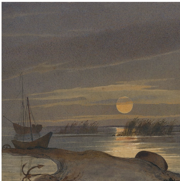
Т. Г. Шевченко. Місячна ніч на Кос-Аралі. Папір, акварель, 1848-1849 рр.