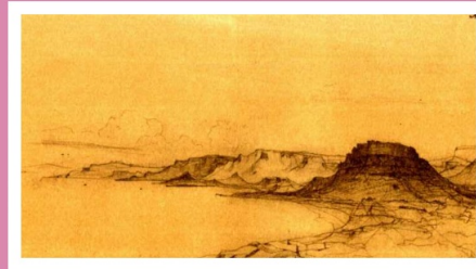
Скелястий берег Аральського моря. Тонований папір, олівець. 1848-1849