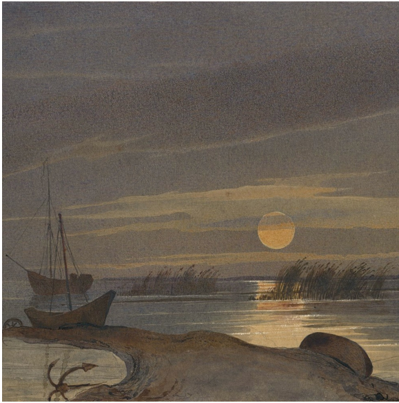
Т. Г. Шевченко. Місячна ніч на Кос-Аралі. Папір, акварель, 1848-1849 рр.