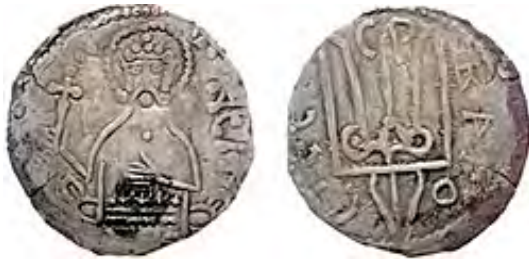
Срібна монета Володимира Великого із зображеннями тризуба

До наших днів дійшли монети, на одному боці яких зображено портрет Володимира, а на іншому — тризуб. Деякі вчені стверджують, що цей знак — монограма (стисле зображення кількох літер) імені князя (ось іще одна теорія, до тих, які ми згадували на початку!).