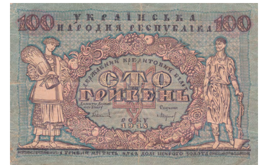
Гривні УНР із тризубом