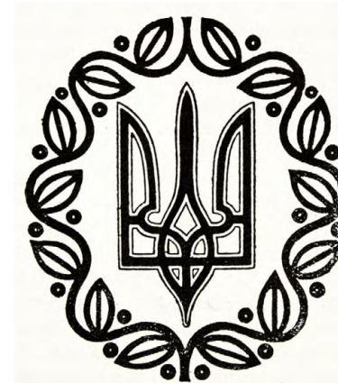
Герб Української Народної Республіки

Його почали використовувати в діловодстві та грошовому обігу. Було виготовлено печатки із тризубом, надруковано банкноти української гривні.