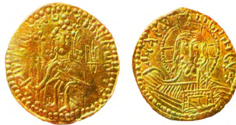
Златник Володимира Великого

Загалом тризуб можна побачити на печатках, монетах, цеглі, настінних розписах періоду Русі.