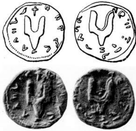
Печатка Святослава Ігоревича із зображенням двозуба

Коли дивишся на малюнок, у тебе виникає запитання: "Державний герб — тризуб, а на печатці — двозуб. Як це пов'язано?". Кожен князь мав свої символи влади, які ставилися на печатках, монетах тощо. Двозуб був символом влади князя Святослава. Його син Володимир успадкував батьківський символ і вніс свої зміни.