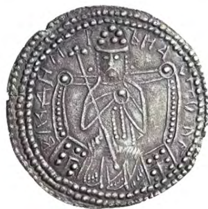
Зображення Володимира Великого на срібнику (X-XI ст.)

Проведи власне мінідослідження: порівняй зображення Володимира Великого на золотих та срібних монетах і Костянтина Мономаха. Який символ влади зображено? Про що це може свідчити?