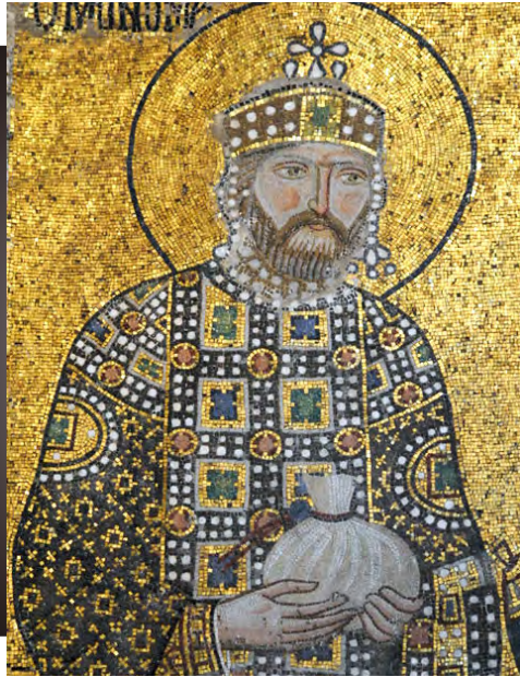
Костянтин ІХ Мономах. Мозаїка ХІ ст. у соборі Святої Софії (Стамбул, Туреччина)

Якщо роздивитися зображення головного убору імператора Візантійської імперії, то стає зрозуміло, що це золота корона з разками прикрас. І жодної шапки!