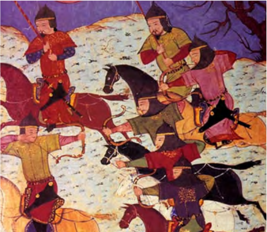
Монгольські лучники. Мініатюра з перського літопису "Джамі ат-Таваріх" XIV ст.

Фейки можуть бути дуже живучими! Щоб не потрапити на їхній гачок, усю інформацію завжди треба перевіряти в кількох джерелах й аналізувати її. ●◆■◀◆