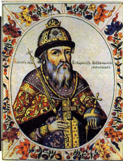
Володимир Мономах. Портрет з російського "Царского титулярника" 1672 року

Володимир Мономах був київським князем і правив Руською державою на початку XII століття.