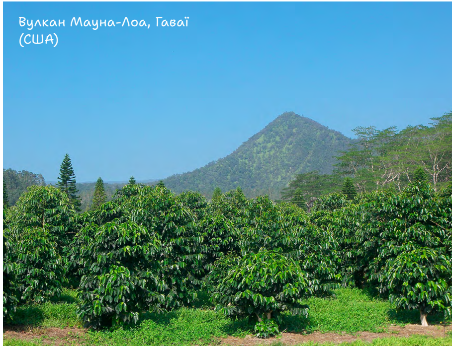
Вулкан Мауна-Лоа, Гаваї (США)

Цікаво, що попри очевидну небезпеку люди продовжують селитися біля підніжжя вулканів. Чому? Через родючий ґрунт, збагачений вулканічним попелом. Наприклад, поблизу гавайського вулкана Мауна-Лоа вирощують один із найдорожчих у світі сортів кави — кона (різновид арабіки).