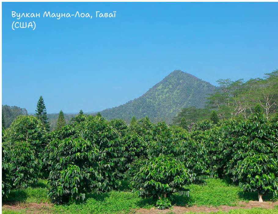
Вулкан Мауна-Лоа, Гаваї (США)

Утім, вирушаючи на відпочинок у місцевість, де є вулкан, хай навіть і згаслий, слід уважно стежити за повідомленнями служб безпеки. І хоча виверження вулкана — справді фантастичне видовище, спостерігати за ним краще здалеку, а ще безпечніше — на екрані свого смартфона. ●◆■◀▶