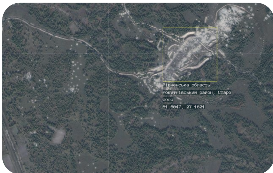
Супутниковий знімок Полісся

— Подивися на цей знімок із супутника. Це наше По-лісся. Точніше таким, як воно стало після масового видо-бування бурштину за останні роки. Наче місячний пейзаж на місці лісу.