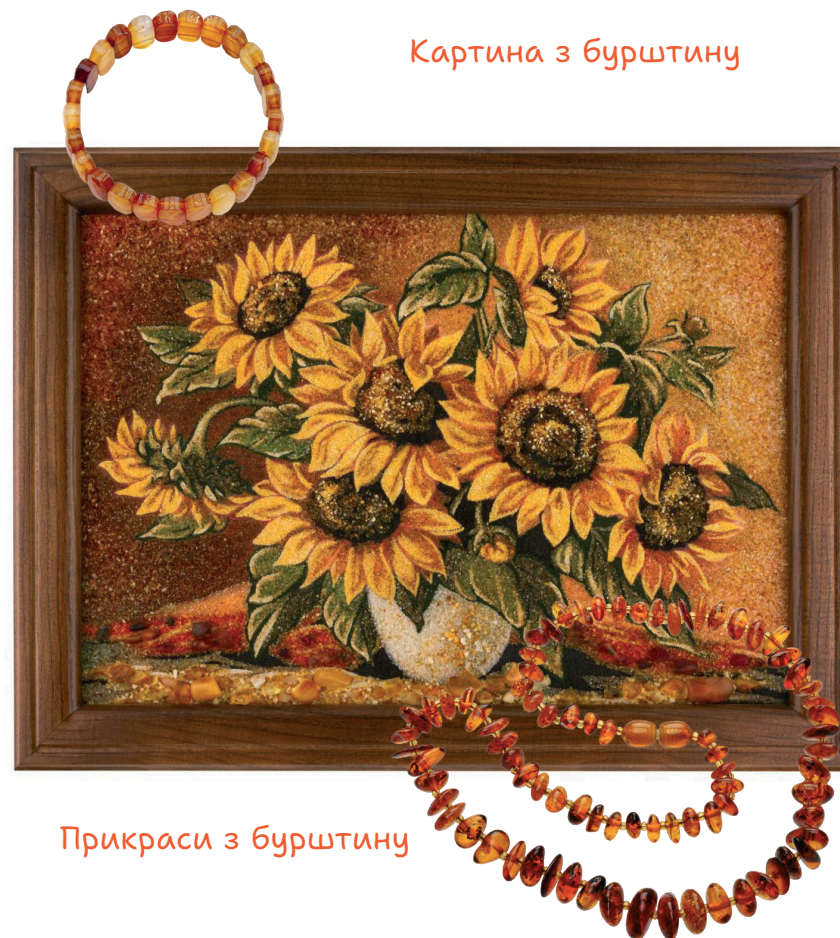
Прикраси з бурштину