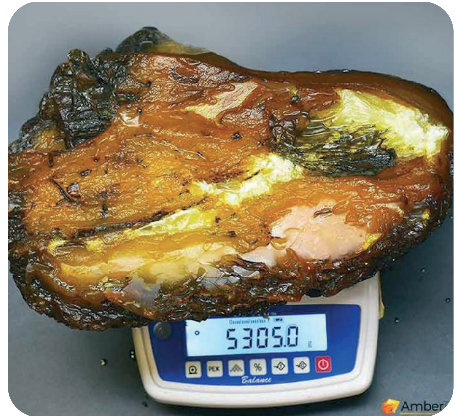
шматок бурштину вагою понад 5 кг