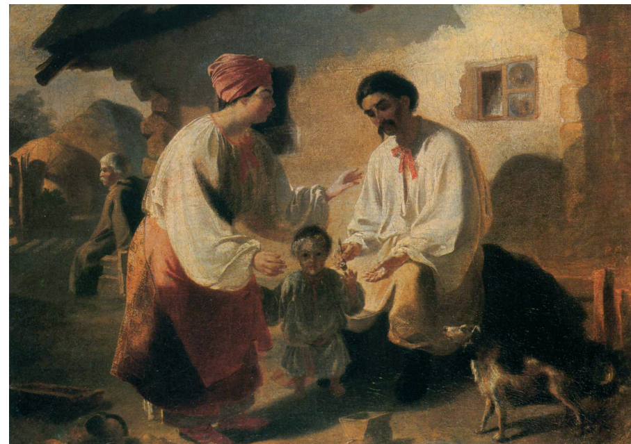
Тарас Шевченко. Селянська родина, 1843 рік