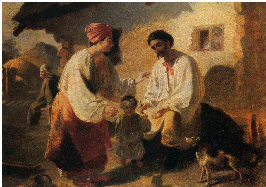
Тарас Шевченко. Селянська родина, 1843 рік