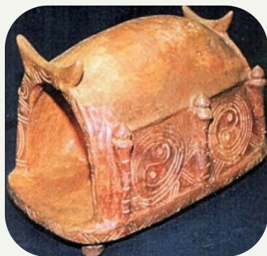
Моделі трипільського житла