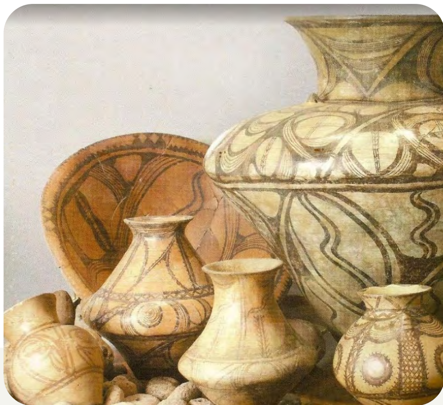
Керамічний посуд трипільців

Трипільські майстри виготовляли керамічний посуд, який гарно розписували різними малюнками, переважно чорного кольору.