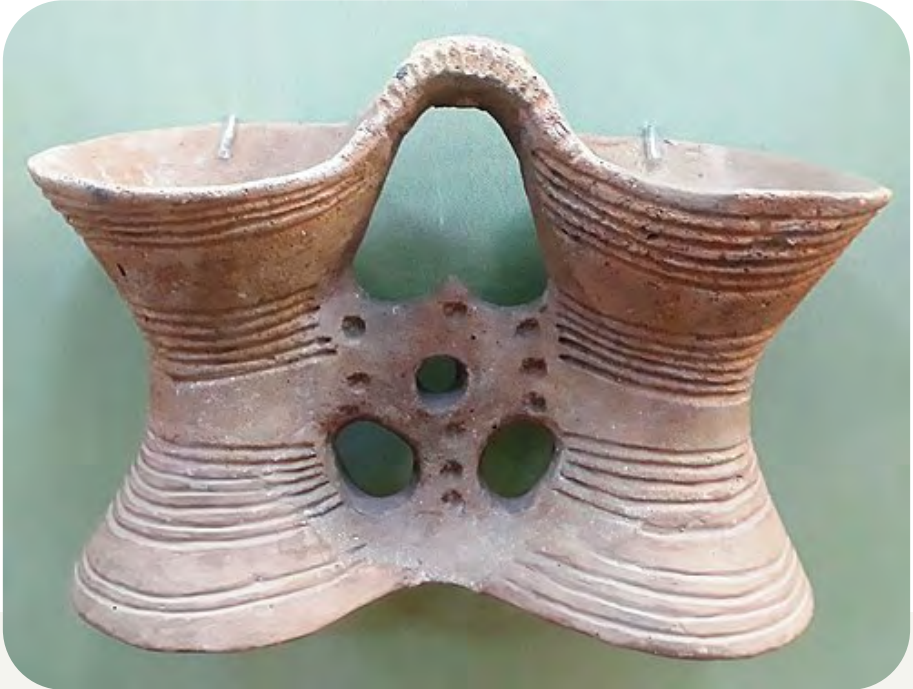
Трипільська біноклевидна посудина

Але найбільш загадковим трипільським виробом є біноклевидна посудина. Їх знайдено чимало на різних поселеннях. Але досі не встановлено їх призначення.