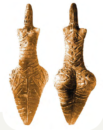
Трипільська жіноча фігурка

Також знайдено багато глиняних фігурок, передусім жіночих. Дослідники переконані, що в трипільців був поширений культ Богині-матері та родючості. Трапляються й фігурки тварин: биків, кіз, овець.