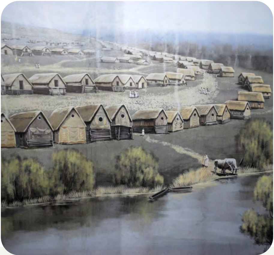
Трипільське поселення. Ірина Костенко