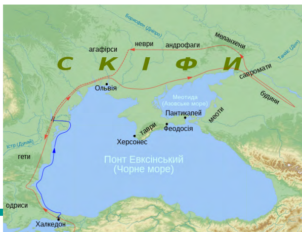
Карта походу персів на скіфів