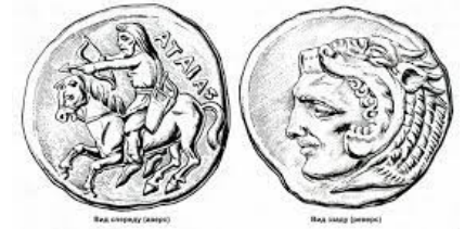
Монета скіфського царя Атея (IV ст. до н.е.)

Скіфи не зводили будинків, а жили у возах, накритих шкірою. Носили шкіряний одяг і коротенькі чобітки. Розводили рогату худобу. І тільки-но закінчувалася трава для її випасання — переходили на нове місце.