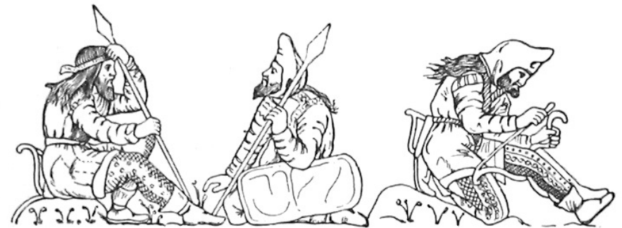
Зображення скіфів на чаші з кургану Куль-Оба