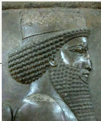
Зображення перського царя Дарія I

Персія — стародавня держава, що була на території сучасного Ірану.