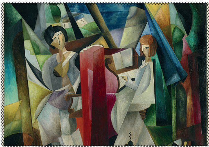
Олександра Екстер, «Урок музики», 1925 рік