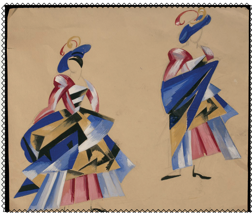
Олександра Екстер, дизайн костюмів для «Ромео і Джульєтти», 1921 рік

Після падіння УНР 1921 року Олександра Екстер переїхала до Москви та 3 роки працювала там, викладала. Однак тоталітарна советська держава не давала можливостей для розвитку вільної творчості. Тож за першої нагоди в 1924 році художниця виїхала на міжнародну виставку до Венеції й не повернулася.