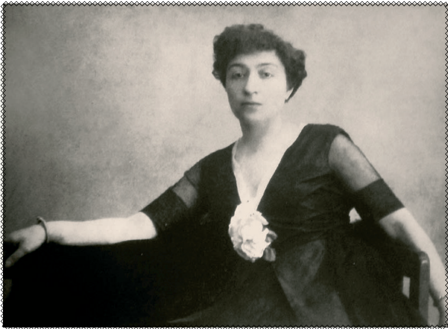
Олександра Екстер 1910-ті роки

Після навчання Ася вирушила в тур Європою: у Парижі познайомилися з провідними кубістами Пабло Пікассо та Жоржем Браком , у Римі спілкувалася з футуристами.