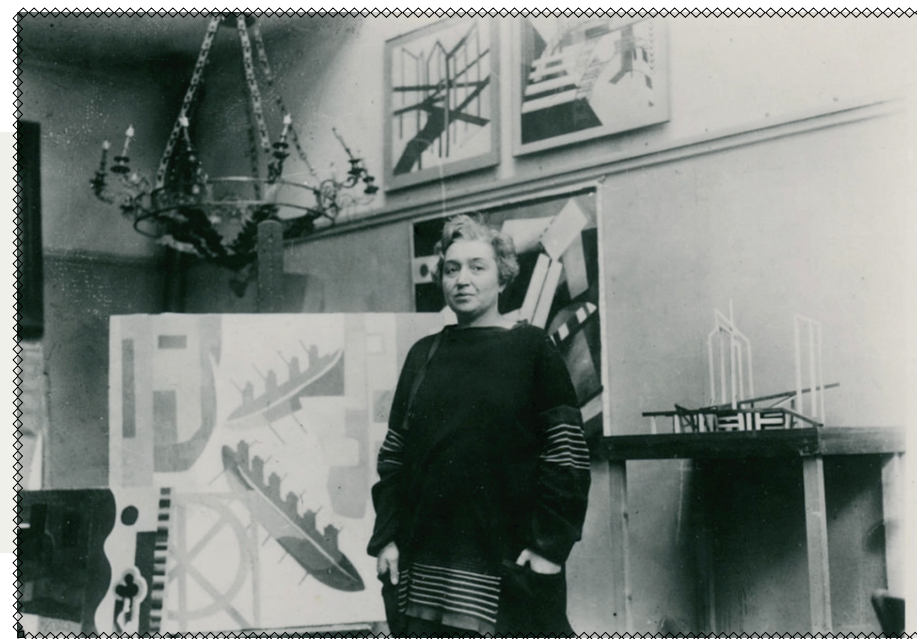
Олександра Екстер у своїй майстерні