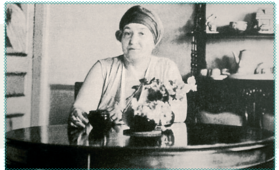
Олександра Екстер 1930-ті роки

Рідний Київ також змусили забути Олександрю Екстер, хоча в цьому місті пройшли насичені роки її навчання, творчої та виставкової активності. У Києві вона сформувалася як художниця. Однак ми потроху повертаємо собі своє. Перша виставка робіт Олександри Екстер у Києві (не беручи до уваги прижиттєві) відбулася у 2008 році. А у 2023 році на її честь назвали одну з вулиць у Деснянському районі столиці, яка до цього носила ім'я російської поетеси Марини Цвєтаєвої. ●◆■◀◆