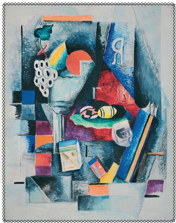
Олександра Екстер. Натюрморт із писанками, 1915

Погляньте-но лише на одну з картин Олександри Екстер — яскравий, епатажний, геометрично-грайливий, наче зібраний дбайливою рукою з уламків “Натюрморт із писанками” .