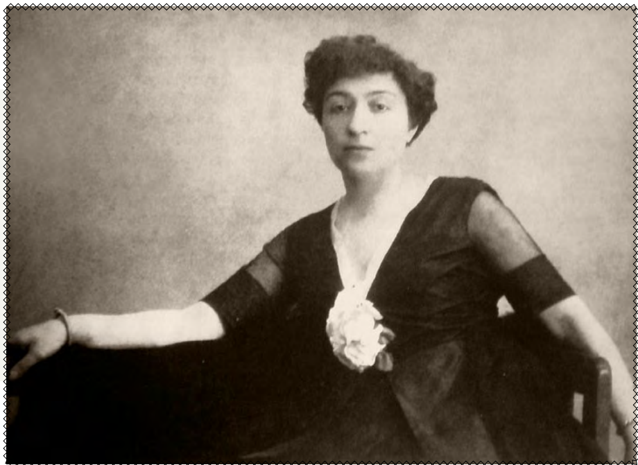
Олександра Екстер 1910-ті роки

Після навчання Ася вирушила в тур Європою: у Парижі познайомилися з провідними кубістами Пабло Пікассо та Жоржем Браком , у Римі спілкувалася з футуристами.