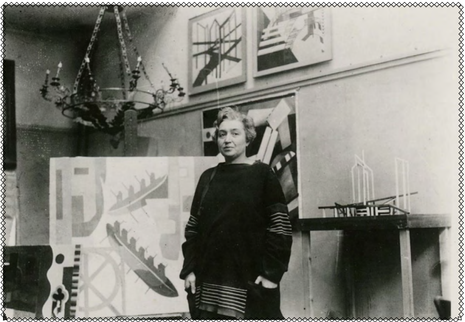
Олександра Екстер у своїй майстерні