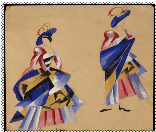
Олександра Екстер, дизайн костюмів для «Ромео і Джульєтти», 1921 рік

Після падіння УНР 1921 року Олександра Екстер переїхала до Москви та 3 роки працювала там, викладала. Однак тоталітарна советська держава не давала можливостей для розвитку вільної творчості. Тож за першої нагоди в 1924 році художниця виїхала на міжнародну виставку до Венеції й не повернулася.