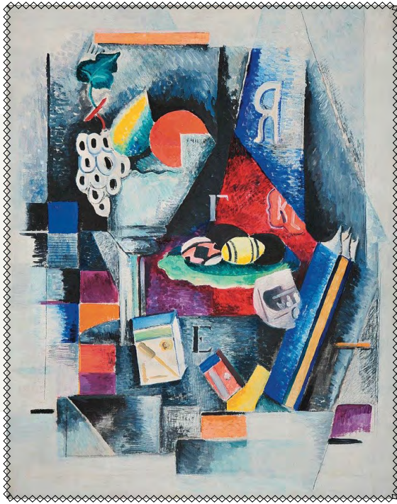
Олександра Екстер. Натюрморт із писанками, 1915

Погляньте-но лише на одну з картин Олександри Екстер — яскравий, епатажний, геометрично-грайливий, наче зібраний дбайливою рукою з уламків “Натюрморт із писанками” .