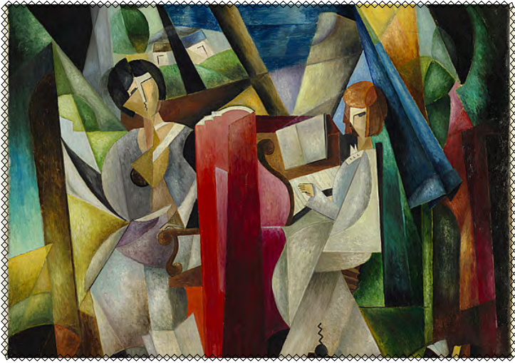
Олександра Екстер, «Урок музики», 1925 рік