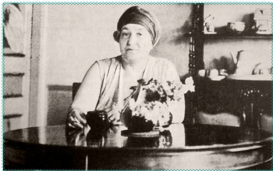
Олександра Екстер 1930-ті роки

Рідний Київ також змусили забути Олександрю Екстер, хоча в цьому місті пройшли насичені роки її навчання, творчої та виставкової активності. У Києві вона сформувалася як художниця. Однак ми потроху повертаємо собі своє. Перша виставка робіт Олександри Екстер у Києві (не беручи до уваги прижиттєві) відбулася у 2008 році. А у 2023 році на її честь назвали одну з вулиць у Деснянському районі столиці, яка до цього носила ім'я російської поетеси Марини Цвєтаєвої. ●◆■◀◆