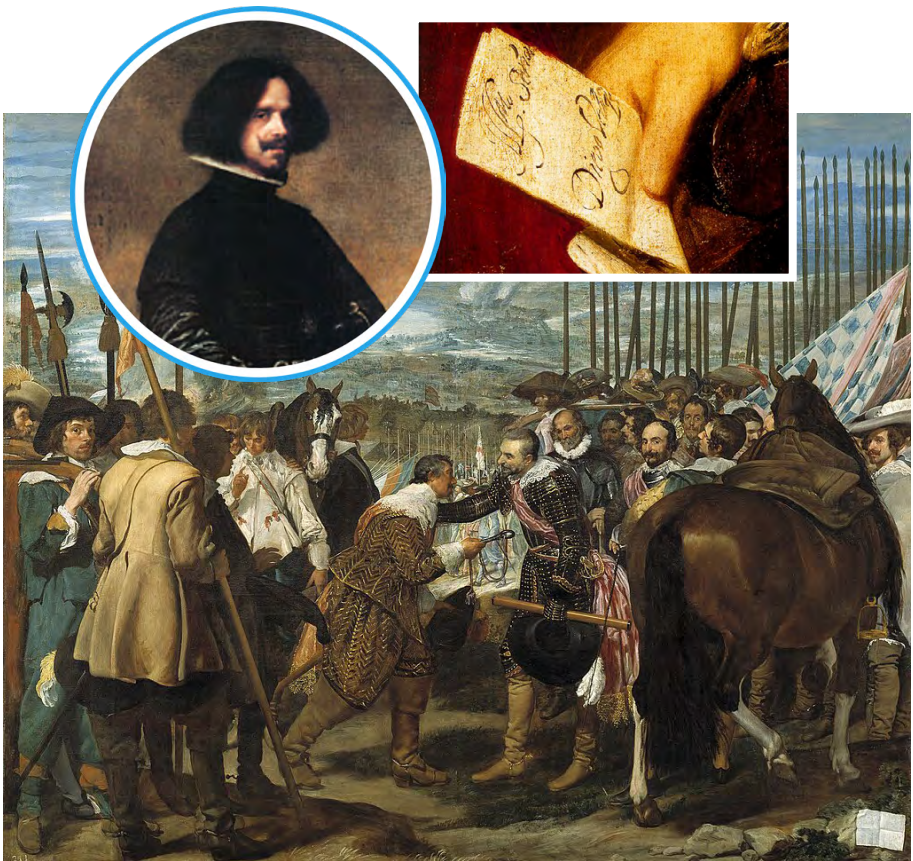
Здача Бреди, Дієго Веласкес, 1625

Тренд на приховані деталі використовував й іспанський художник Дієго Веласкес . Його улюбленою фішкою були записки. Він “укладав” їх у руки персон, яких малював. А на історичному полотні “Здача Бреди” художник “підкинув” банківську квитанцію зі своїм прізвищем ледь не під копита коня, зобразивши її в правому нижньому куті картини. Крім того, на картині ще є ймовірний автопортрет Веласкеса: чоловік за конем, що дивиться на глядача. Це також своєрідна мітка, що промовляє: “Це моя картина”.