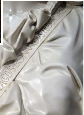
П’єта, мрамур, Мікеланджело Буонаротті, 1498-1499