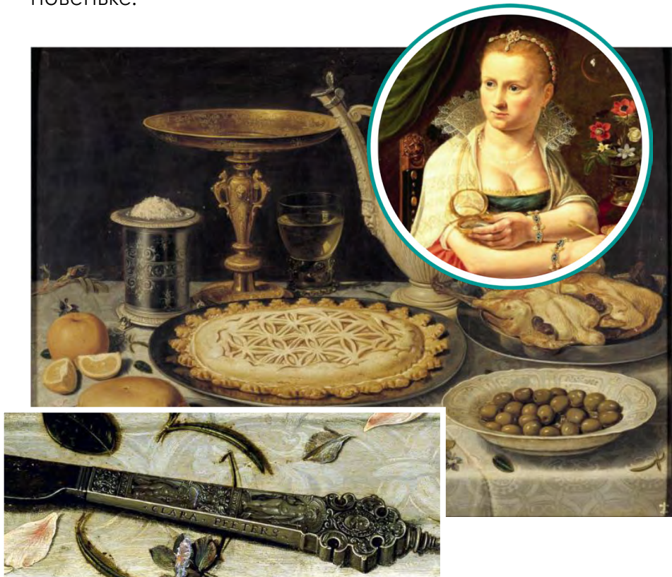
Натюрморт з апельсинами, оливками та пирогом, Клара Петерс, 1611

Нідерландська художниця Клара Петерс спеціалізувалася на створенні натюрмортів. Їй не бракувало фантазії різними способами залишати на них автографи: то напише своє ім'я на ножі у вигляді гравіювання, то “викладе” на талі печиво у формі ініціалів “С.Р.” А на одному натюрморті вона навіть примудрилася намалювати своє відображення на посуді. Загалом замовникам тих часів подобалося, коли на картині було багато дрібних та прихованих деталей: YouTube ще не було, тож люди радо проводили вільні вечори, роздивляючись картини та вишукуючи щось новеньке.