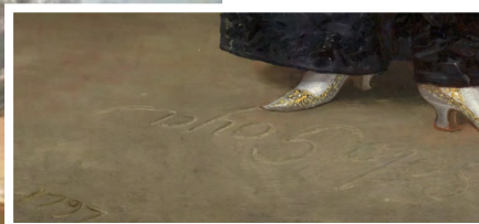
Герцогиня Альба, Франсіско- Хосе Гоя, 1797