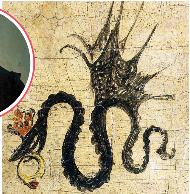
Підпис Лукаса Кранаха Старшого, зображення з портрета 1514 року