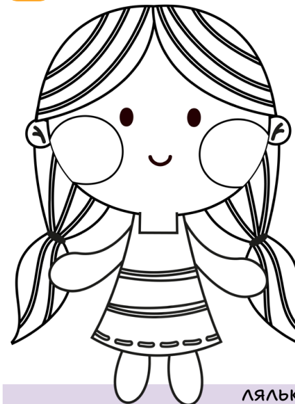
лялька — лялечка

Порівняй: будинок — будиночок, словник — словничок, рука — рученька, дід — дідуць, лялька — лялечка.