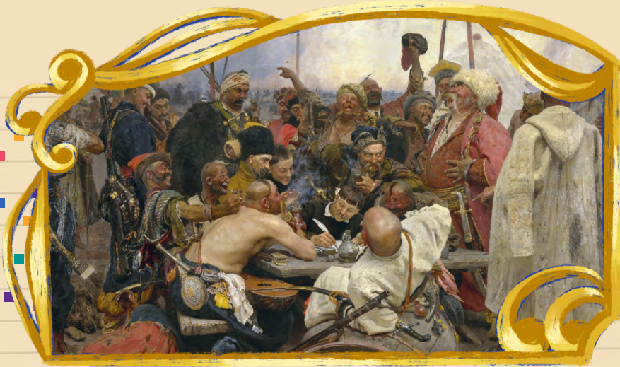
Ілля Ріпін. Запорозжці пишуть листа турецькому султанові

— Яким же це треба бути сильним і сміливим!