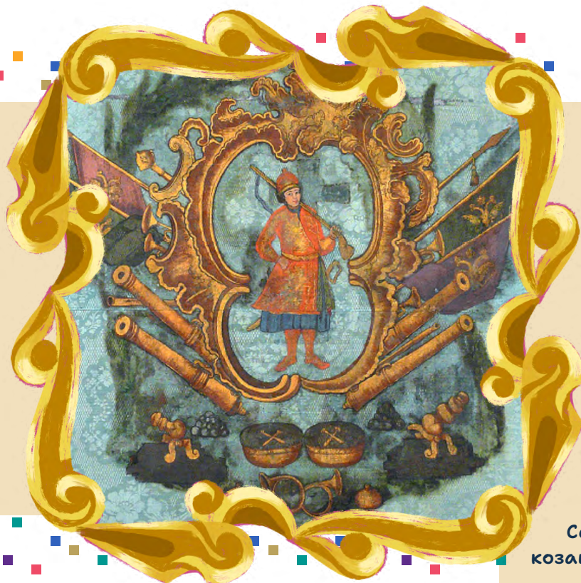
Прапор Сенчанської козацької сотні

Наприклад, козацький чуб ще називають "оселедцем". Тож слово означає і вид риби, і зачіску .