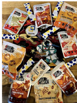
КОСМІЧНИЙ ХАРЧ №3 (веганський)

До речі, є навіть веганський космічний харч для тих, хто не вживає м'яса. Чесно кажучи, такий я ще не куштував, бо прикипів до цього, але побратими кажуть, що він теж надзвичайно смачний.