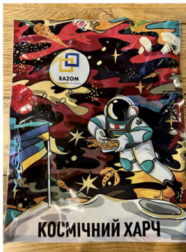
КОСМІЧНИЙ ХАРЧ №2