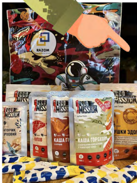
КОСМІЧНИЙ ХАРЧ №1