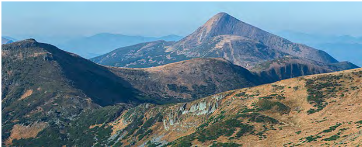
Гора Говерла, Україна

— Оооо, широкі поля, густі ліси, річки, аж два моря — Чорне й Азовське, навіть пустеля — Олешківські піски, — почала загинати пальці Марічка. — Та найбільше я люблю гори. Колись із батьками я зійшла на найвищу вершину Українських Карпат — Говерлу! 2061 метрів, до речі!