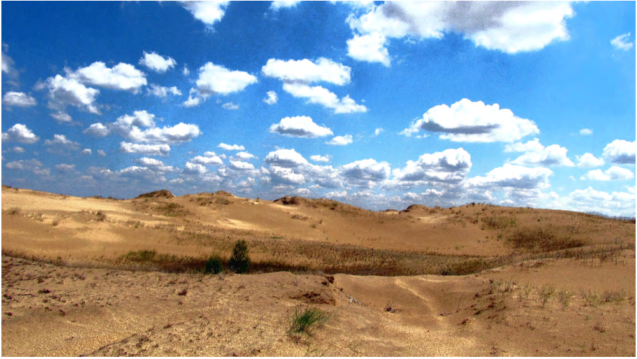
Олешківські піски, Україна