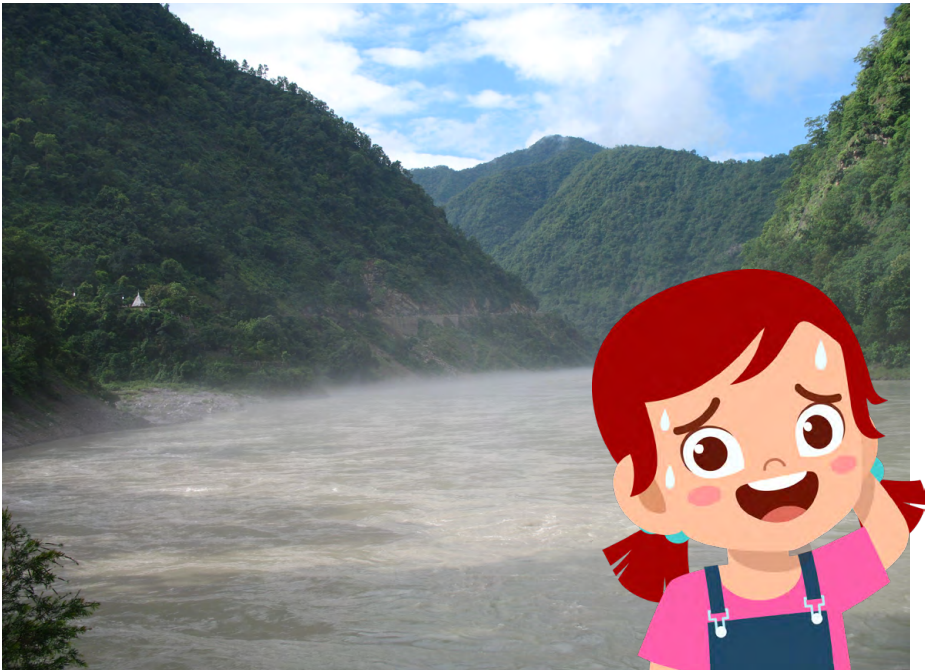
Ріка Ганг, Індія

— Не їж мене, крокодиле, — оце й усе, що зі страху змогла вимовити Марічка.