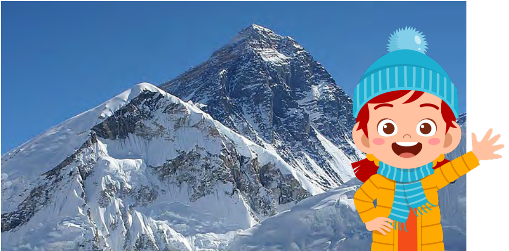
Гора Еверест, Непал