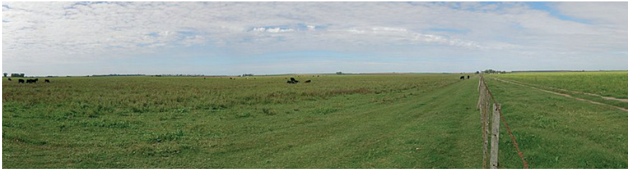
Пампа у провінції Ла-Пампа

— Скільки всього най-най-най у Південній Америці, — захоплено вигукнула Марічка, стоячи на найвищій вершині Анд — горі Аконкагуа .