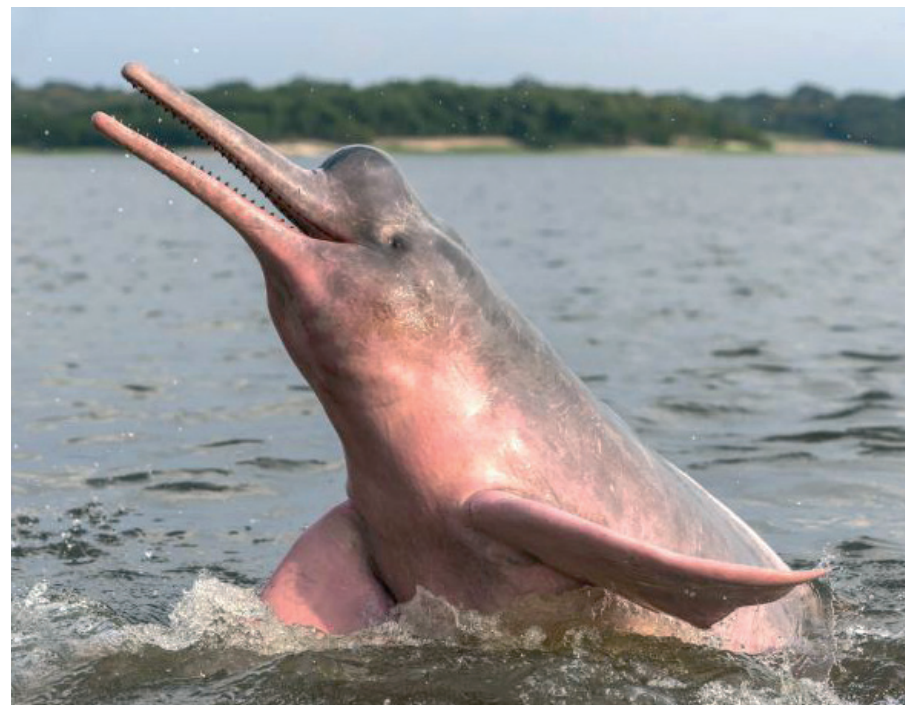
Рожевий амазонський дельфін

Першим, кого зустріла Марічка в Південній Америці, був рожевий амазонський дельфін . Дівчинка ду-у-уже здивувалася, адже вважала, що дельфіни живуть лише в морях та океанах.