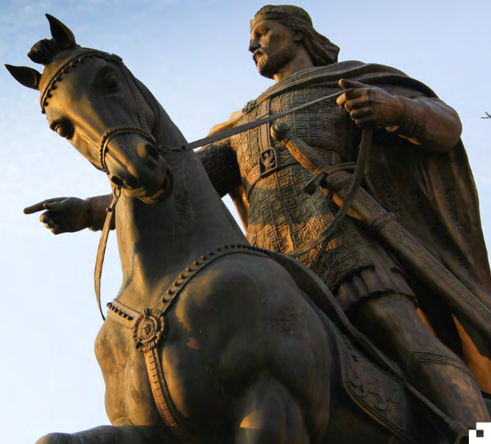
Пам'ятник Данилу Романовичу у Львові

А як щодо України? У нас теж були свої королі!