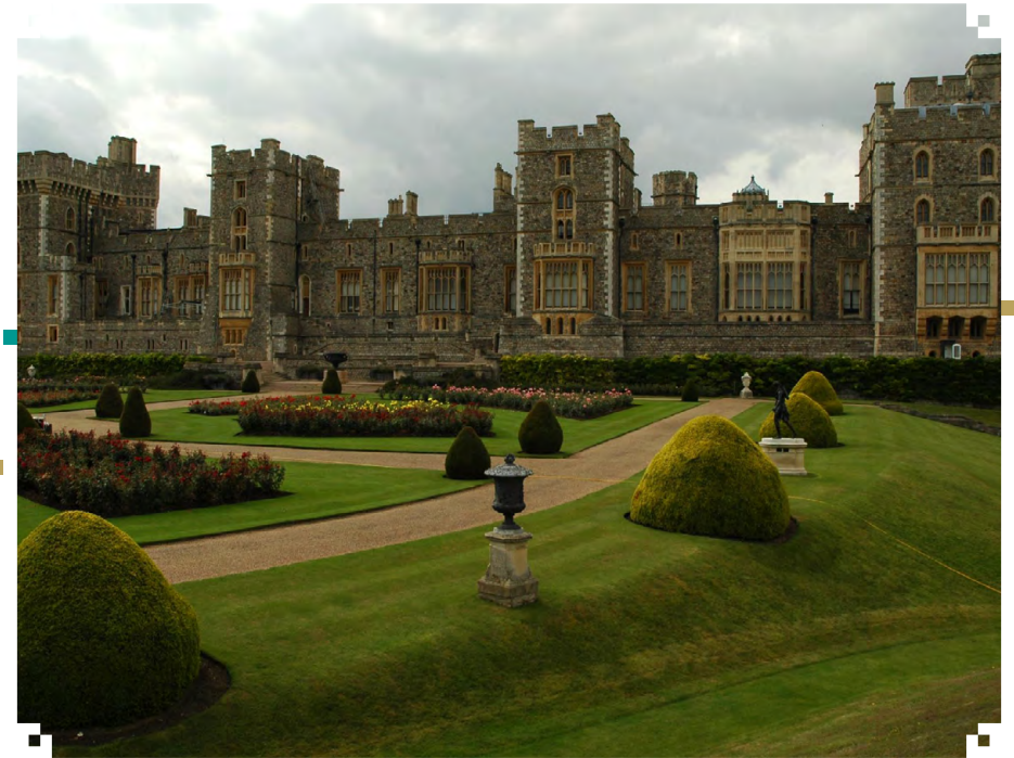
Віндзорський королівський замок в Англії