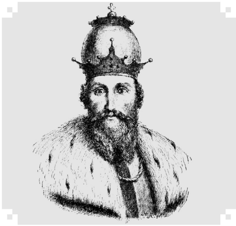
Портрет короля Данила