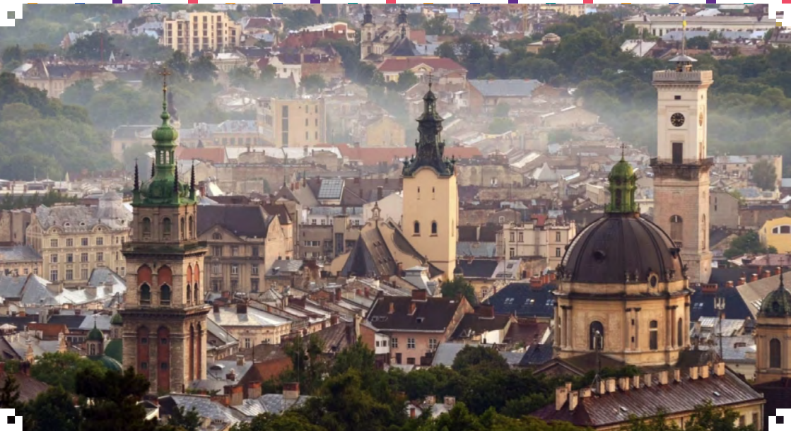
Львів — місто королів