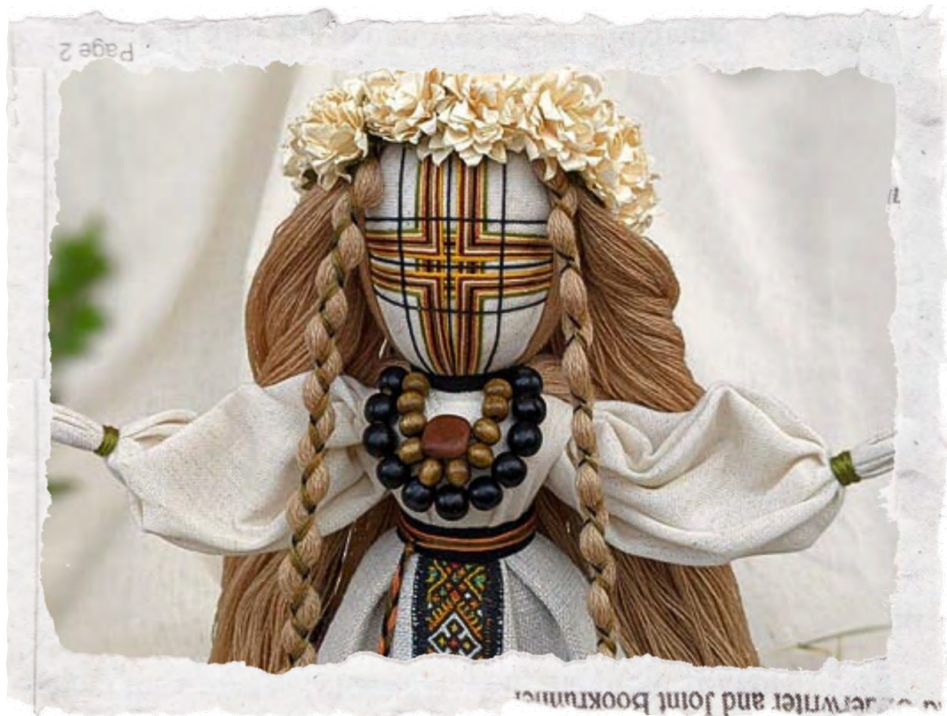
Лялька-мотанка, автор невідомий

І сьогодні українські майстрині виготовляють такі ляльки. Ти теж можеш спробувати.