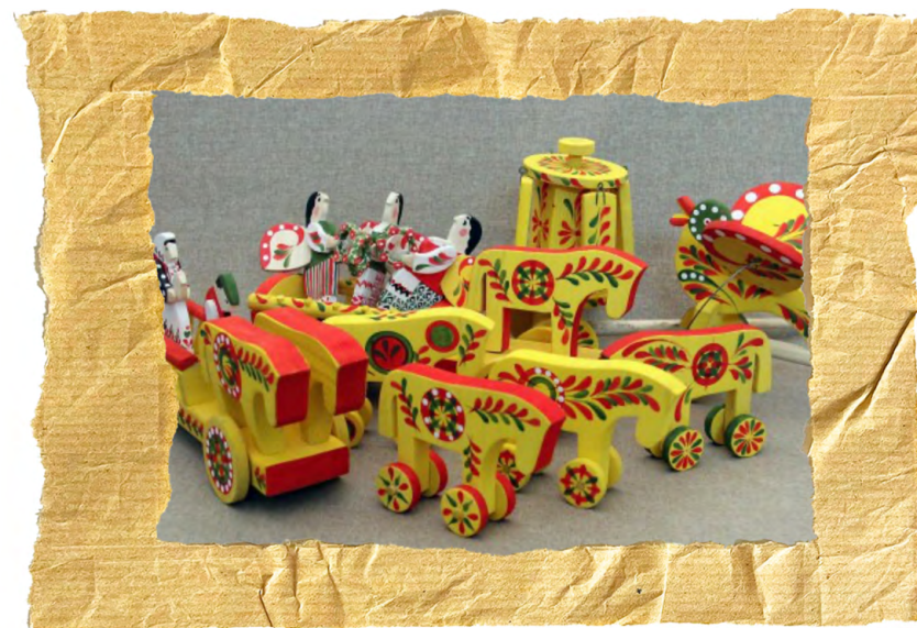
Яворівські іграшки, Василь Яремін