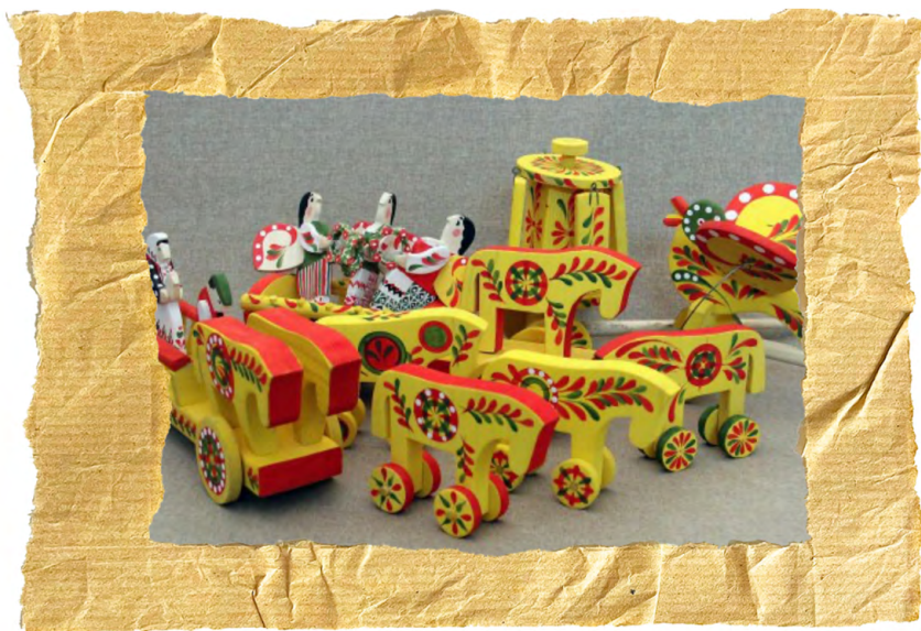
Яворівські іграшки, Василь Яремін