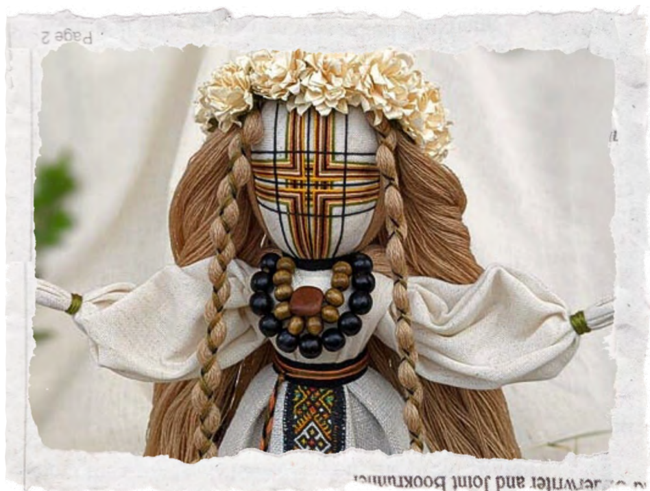
Лялька-мотанка, автор невідомий

І сьогодні українські майстрині виготовляють такі ляльки. Ти теж можеш спробувати.